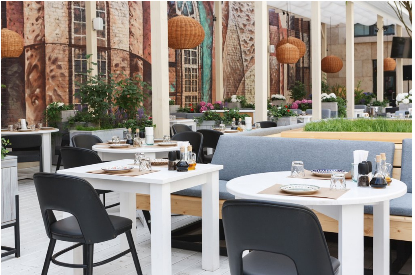
На фотографии: «Сыроварня»