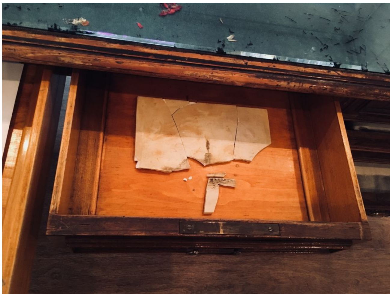
Фрагмент экспозиции Михаила Заиканова

Серию выставок открыл Илья Гришаев. График, скульптор и автор декоративных росписей в городской среде, выходец из Перми Гришаев закончил Художественно-промышленную Академию имени Штиглица и стал известен в Петербурге как приверженец автоматического письма в традиции сюрреалистов. В последние годы его искусство набирает популярность, так что художник все чаще оформляет монументальными монохромными рисунками большие площади, – в частности, он был участником основного проекта последней Молодежной биеннале в Москве. Именно эта работа послужила основой выставки в набоковском музее. Всегда подробно документирующий свои инсталляции и временные росписи художник на этот раз перенёс созданный этим летом на Красной Пресне орнамент, оттиснув его на льняных полотнищах. В залах музея он скопировал фрагменты рисунка на толстое стекло, закрывающее поверхность стола с зеленым сукном. Между тесных черных линий, на стекле больше напоминающих трещины, затерялись только два ярких изображения – цветка и бабочки, неизменного набоковского образа.